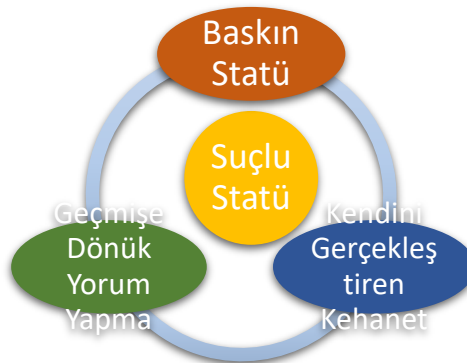
Şekil 1. Damgalama Teorisinin Genel Görünümü

Lemert (1979), konuya yönelik bakış açısında birincil ve ikincil sapma kavramlarını geliştirmiştir. Buna göre birincil sapma norm ihlali olarak tanımlanırken, ikincil sapma bu rollerin tanınmaya başlanması ve yaptırım uygulanması süreci ile birlikte başlamaktadır. Becker'in (1963) belirttiği gibi, hangi davranışların sapma davranış olarak nitelendirileceği hususunda ise bireylerin bir nevi 'öteki' olarak gördükleri kişilerin davranışları ön plana çıkmaktadır. Toplumsal açıdan suç olarak görülen davranışı işleyen bireylere uygulanan yaptırım süreci ise damgalamayı pekiştirmektedir (Dursun, 1997). İkincil sapmayı gerçekleştiren bireyler kendilerini yeniden sosyalizasyon süreci içerisinde bulmaktadır. Bu açıdan da kimliğin yeniden inşası söz konusu olmakta, bireyler kendilerini zaman zaman suç işleme rolüne hapsedebilmektedir. Böylelikle kendilerini yeniden sapmış davranış içerisinde bulmaları daha da kolay hale gelebilmektedir.